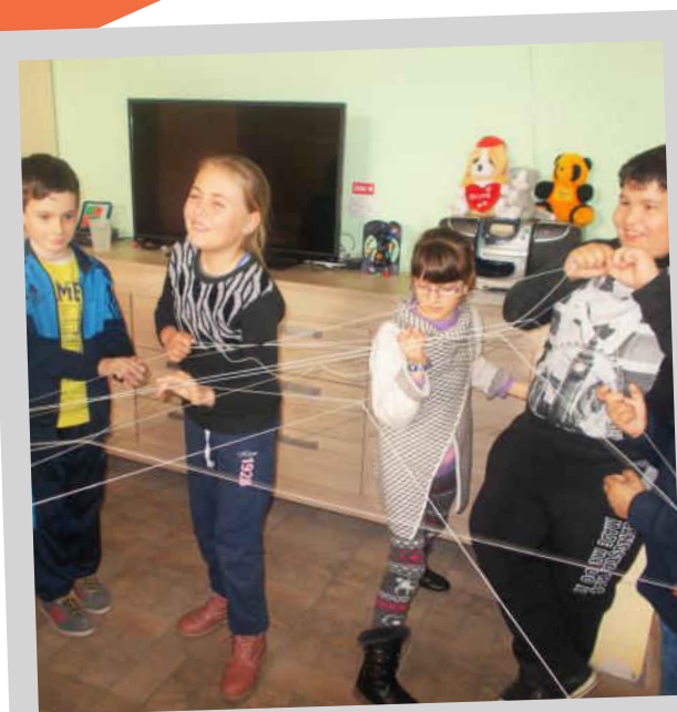
Peste 150 de copii din Bucșani implicați în activități zilnice educative, recreative și terapeutice: Școli de vară, ateliere de educație non-formală, PhotoVoice și bune maniere, campionate sportive, excursii în Giurgiu și București, schimburi de experiență cu școli internaționale, gustări zilnice.